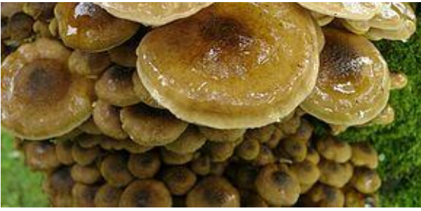
Sensible à l'Armillaire