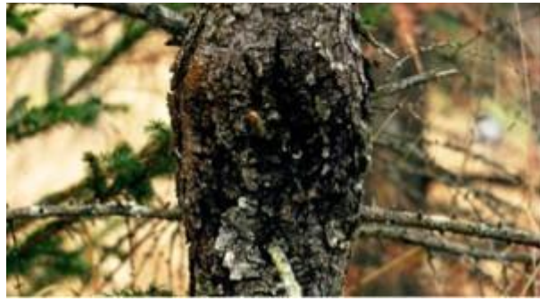
Le chancre du Méléze